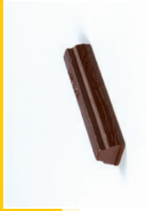
140 000: Weichwachs, Soft Wax, Cire Malleable, Cera Blandia, Waskit, Cera morbida