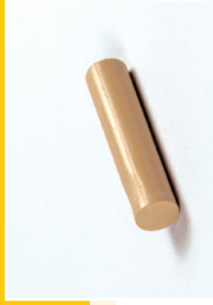
130 000: Füll-Fix, Quick Filler, Sticks de Bouchage, Cera Superblanda, Vulfix, Füllfix