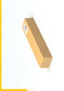
143 000: Hartwachs PLUS, Hardwax PLUS, Cire Dure PLUS, Cera Dura PLUS, Hardwas PLUS, Cera Dura PLUS