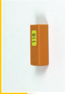
141 000: Hartwachs, Hardwax, Cire Dure, Cera Dura, Hardwas, Cera Dura