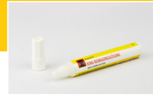
King Reinigungslösung Cleaning Solution

King komplett Set: Mit Düsenpatrone Ø 0,3mm und Schlauch mit Schnellkupplung Complete King set: With nozzle unit Ø 0.3mm and hose with quick coupling