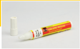
King Acryl-Decklack Acrylic Covering Lacquer