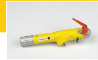
King Handspritzapparat Hand-held Spray Device