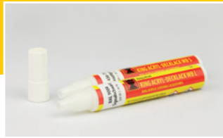
King Acryl-Decklack WBL und WBS Acrylic Covering Lacquer WBL and WBS