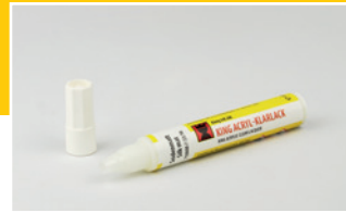
King Acryl-Klarlack Acrylic Clear Lacquer